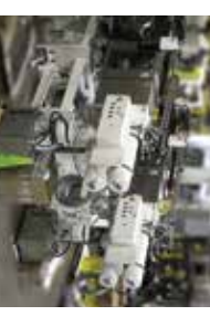
Cambiadores de pantalla dobles y bombas de engranajes proporcionar filtración de polímero refinado y estable condiciones de presión aguas abajo equipo de fibra/filamento