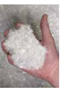
100% capacidad de alimentación de escamas, incluyendo cambios rápidos de formulación y Supervisión REALtime™ IV