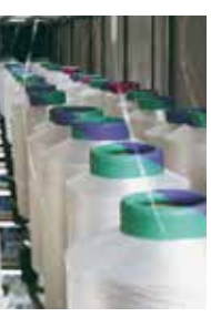
Aplicaciones de filamento continuo a granel, incluida la producción de alfileres a altos rendimientos con condiciones de procesamiento estables