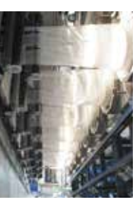
Aplicaciones de fibra estables que alimentan múltiples cabezas giratorias simultáneamente a alta salidas con condiciones de procesamiento estables